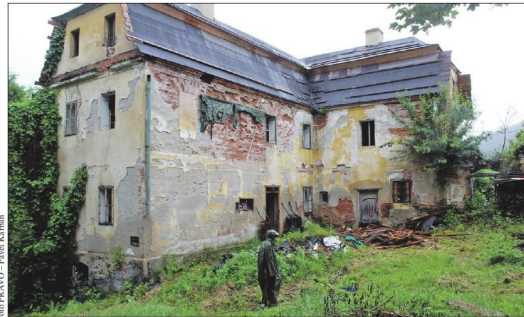
Kvůli záchraně bývalé rychty se sjíždějí dobrovolníci do Karlovic na Bruntálsku už tři roky.

„Nikdo se o to nestaral. Měli jsme investory, ale to bohužel nevyšlo, a tak jsme stáli před dilematem: buď to koupíme ja-