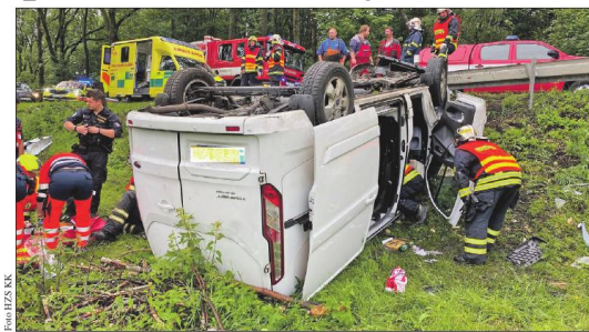
Na první pohled nebezpečně vypadající nehoda způsobila jen lehké zranění řidiče.

„Ve vozidle po nehodě zůstal zaklíněný řidič. Přivolání hasičů může vyprostili a předali posádku záchranné službě.“ uvedl mluvčí karlovarských krajských hasičů Martin Kasal. „Jednalo se nakonec ale jen o lehké zranění, tedy pomohli do dolní končetiny, takže byl muž transportován sanitkou do karlovarské nemocnice.“ dodal mluvčí. Příčiny dopravní nehody policie šetří. (vor)